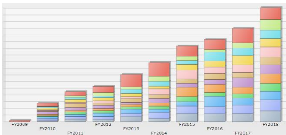
Evolution du chiffre d'affaire (création en décembre 2009)